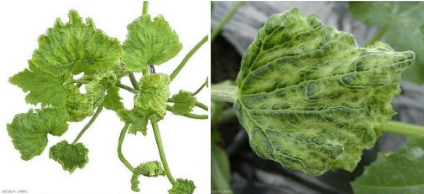
Symptômes du ToLCNDV sur feuilles de courgettes