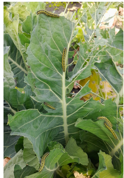
Piérides sur chou

Des tenthredes ont été observées dans le 44 en parcelles de radis et roquettes.