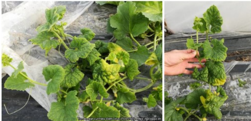
Symptômes du ToLCNDV sur plante