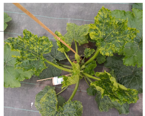
Virus CMV

En parcelle de courgettes à Corné (49), on nous signale la présence du Virus CMV (Cucumber Mosaic Virus) .