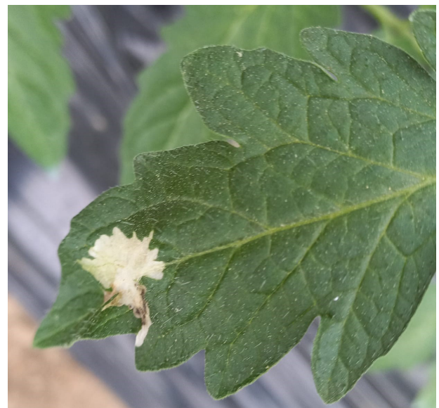
Dégât de Tuta absoluta

Dans le 53, les premiers doryphores ont été observés sous abris.