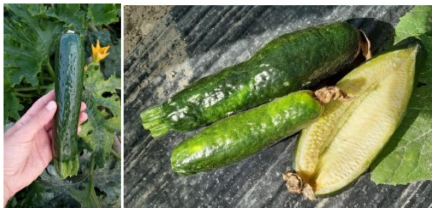
Symptômes du ToLCNDV sur fruit